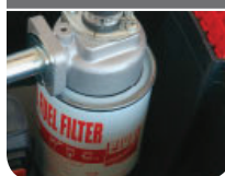
Part # FOO611000