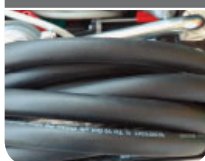
Hose length 20 ft Hose interior ø 3/4"