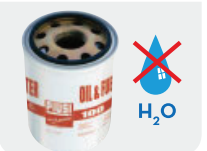
Part # FOO611000